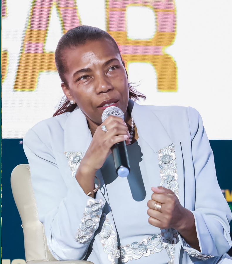
Mme. Sophie RATSIRAKA Ministre de l'Artisanat et des Métiers