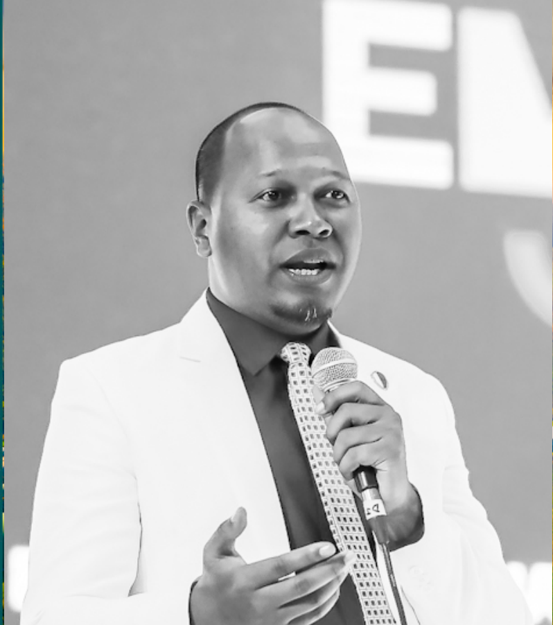
Mr. Andry Heriniaina RAMAROSON Ministre de l'Énergie et des Hydrocarbures