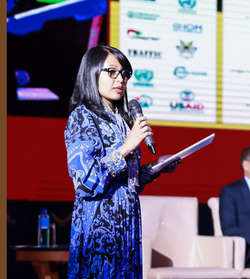
Mme Rindra Hasimbelo RABARININARISON Ministre de l'Économie et des Finances