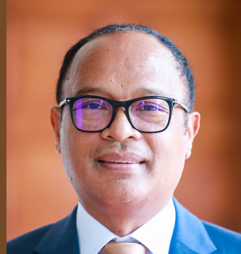
Mr Edgard RAZAFINDRAVAHY

Ministre de l'Industrialisation, du Commerce et de la Consommation