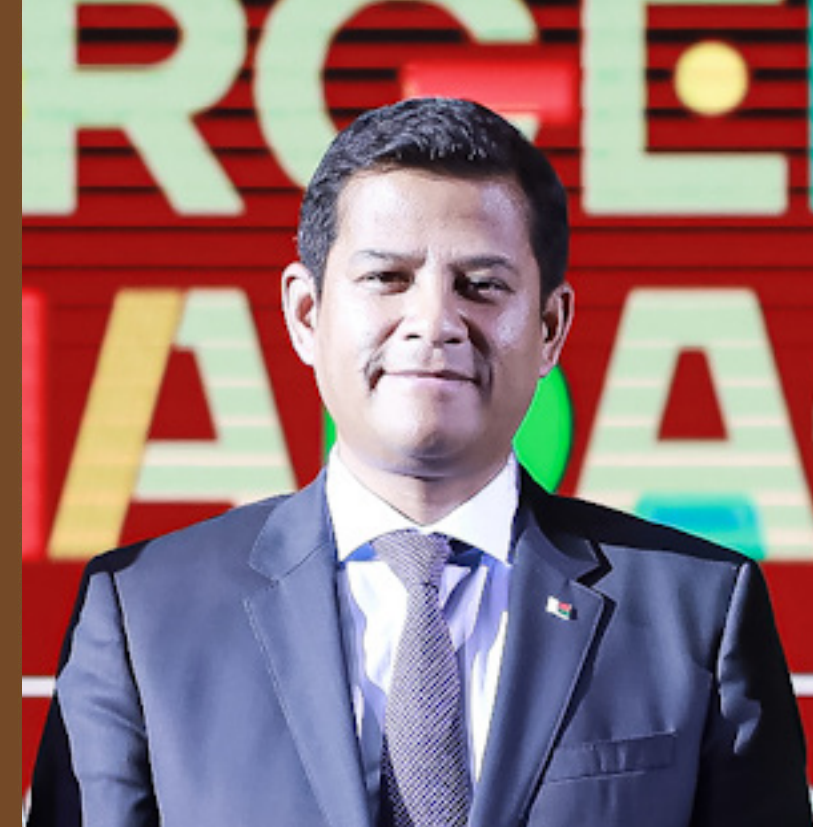
Mr Tahina RAZAFINDRAMALO

Ministre du Développement Numérique, de la Transformation Digitale, des Postes et des Télécommunications